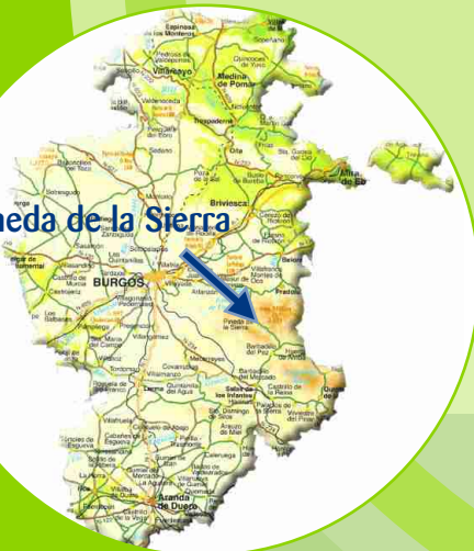
Pineda de la Sierra